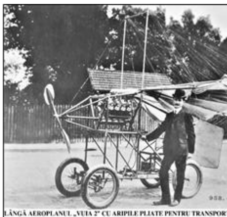
LĂNGĂ AEROPLANUL „VUIA 2” CU ARIPILE PLIATE PENTRU TRANSPORT

Din dorința de a-și realiza marele vis, zborul cu un aparat mai greu decât aerul, în 27 iunie 1902 Traian Vuia pleacă la Paris, orașul mișcării aeronautice mondiale, având în valiză macheta aeroplanului-automobil, concepută și realizată la Lugoj. În ciuda experiențelor nereușite din decembrie 1905, 5 februarie și 6 martie 1906, în 18 martie 1906 visul său devine realitate. Aeroplanul său a rulat mai întâi pe pământ, aproximativ pe o distanță de 50 m, apoi a pierdut contactul cu pământul și a parcurs în zbor o distanță de 12 m, la o înălțime de 0,6–1m, Vuia fiind astfel primul om care s-a desprins de pe pământ cu un aparat mai greu decât aerul, cu mijloace proprii de bord. După alte experiențe de zbor efectuate în anii 1906–1907, Vuia și-a orientat cercetările pentru realizarea unui elicopter, în ciuda neîncrederii specialiștilor epocii, care considerau drept utopie realizarea zborului vertical. El s-a convins de posibilitatea realizării acestei performanțe prin experimentarea, în 18 martie 1922, a elicopterului „Vuia nr. 2” 1 . Din păcate, lipsa mijloacelor financiare l-a obligat pe Vuia să-și întrerupă cercetările, dar nu peste mult timp profeția sa devenea realitate.