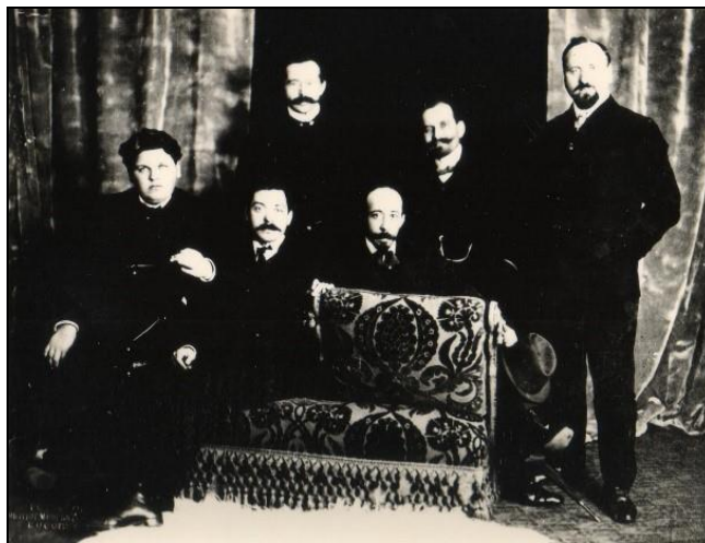
Fotografia nr. 1, Șezătoare literară.

Pe scaune, de la stânga la dreapta: Mihail Sadoveanu, Șt.O. Iosif, Dimitrie Anghel. În picioare, de la stânga la dreapta: Ion Scurtu, Ilarie Chendi, Constantin Sandu-Aldea.