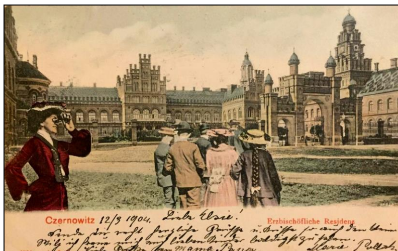
„Czernowitz. Erzbischöfliche Residenz” [Cernăuți. Reședința Mitropolitană], ilustrată serială litografiată, tipărită de Firma L. & P. și expediată în 12 septembrie 1904.